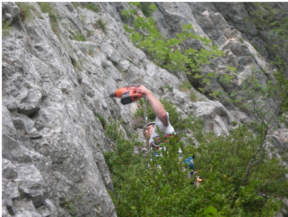
Ouverture de L1: 1er point de la voie