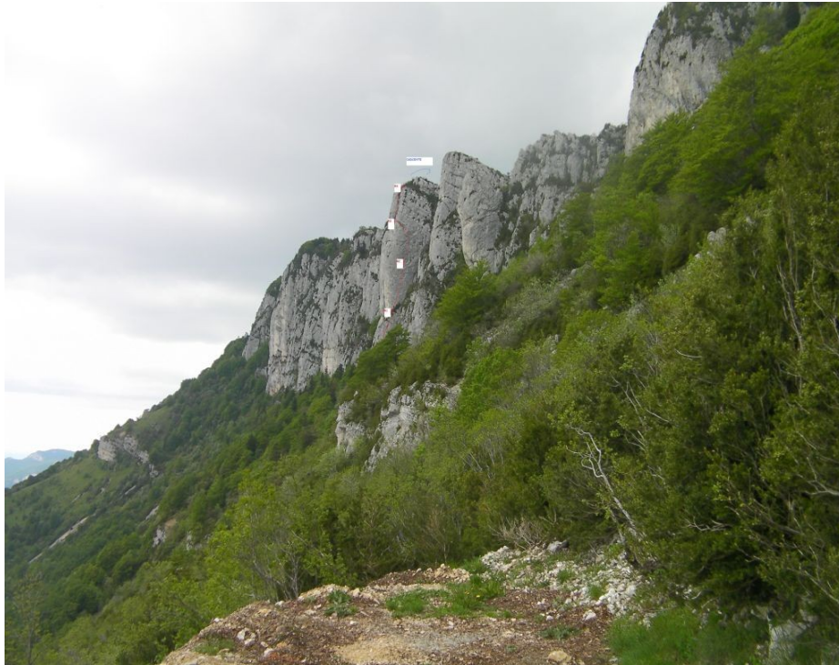
Vue du Parking: localisation du « Chamois Dort »